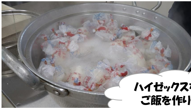
ハイゼックスを使って ご飯を作りました