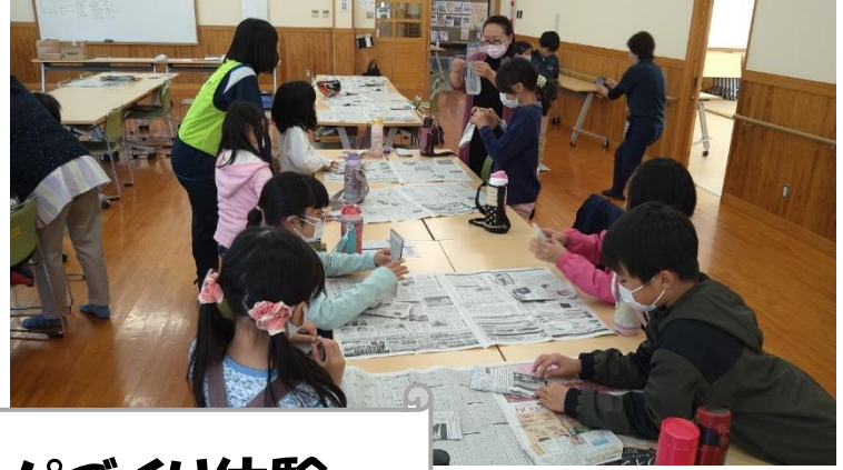
新聞紙スリッパづくり体験